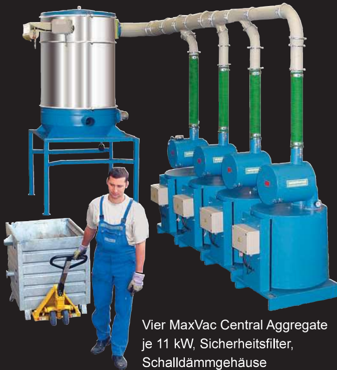
Vier MaxVac Central Aggregate je 11 kW, Sicherheitsfilter, Schalldämmgehäuse

MaxVac Central Aggregate sind von Profis für Profis konzipiert. Die Geräte sind ausgelegt für den harten Dauerbetrieb im industriellen Alltag.